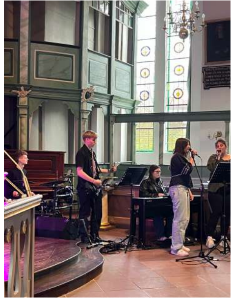
Teamer-Abschluss mit Jugendband